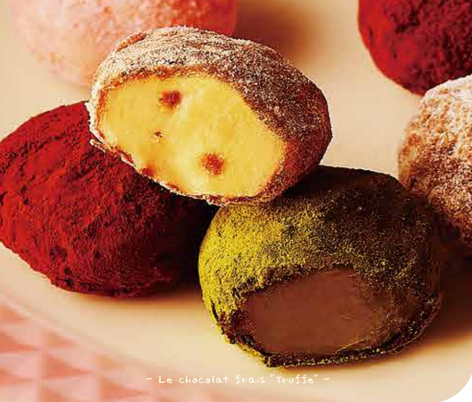
- Le chocolat frais "Truffe" -