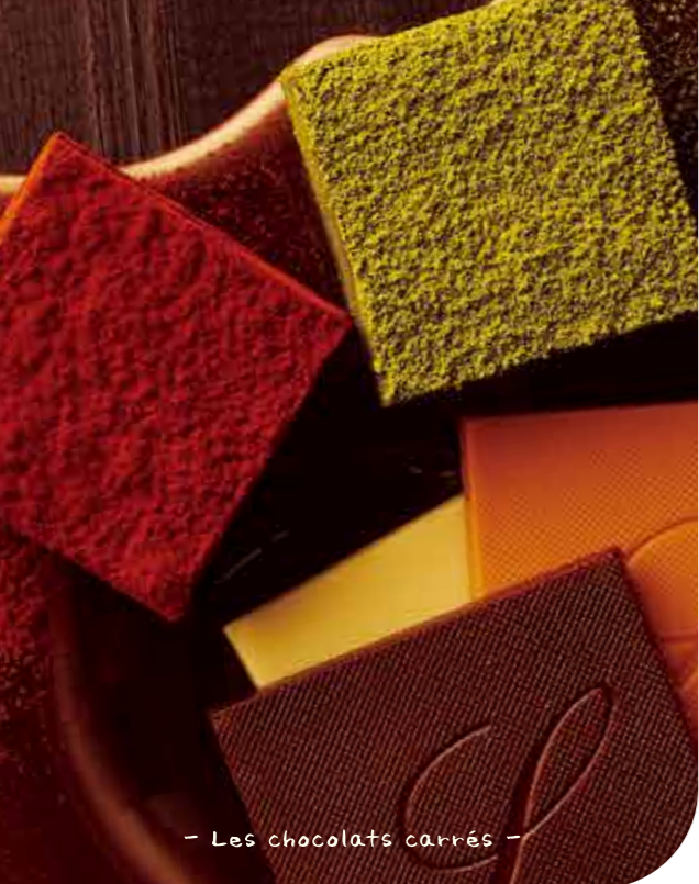
— Les chocolats carrés —