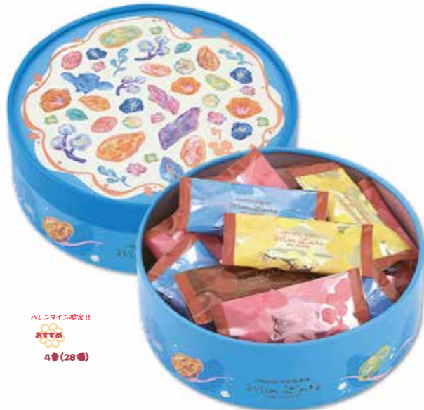
バレンタイン限定!! お菓子部 4色(28個)

アーモンドをたっぷり、チョコレートでからめたブロックチョコ。チョコレートと味わう、カリッとした食感の香ばしいアーモンドのにじみ出るような味わいは、どんどん美味しさがふくらみます。ミルクチョコレートと、バレンタイン限定の3色のチョコレート。それぞれのからみ合う味わいをお楽しみください。