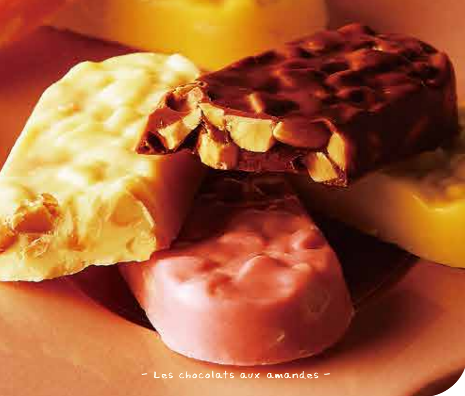
- Les chocolats aux amandes -