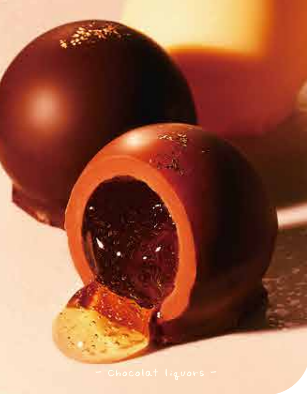
- Chocolat liquors -