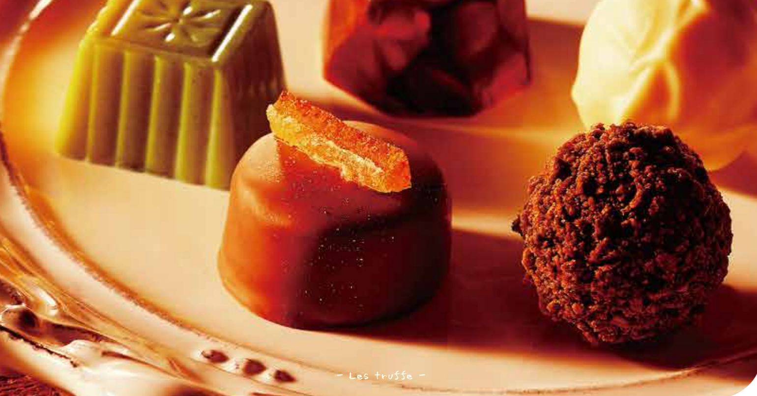
- Les truffes -