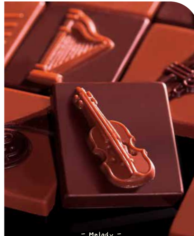
- Melody -