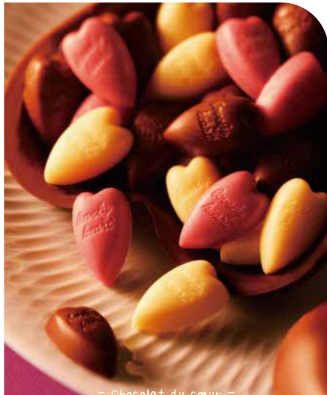
- Chocolat du cœur -