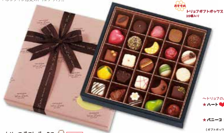
おすすめ トリュフギフトボックス 25個入り

素材にこだわりをもち、いつも、新しいイメージと発見を…と、一粒ひとつぶ丹念に手で作り上げたオリジナルトリュフ。デザイン、個性、豊かな“一粒ひとつぶ”を、味わってみてください。その美味しさを秘めた“きれいな”は、まるで宝石のようです。“バレンタイン限定のトリュフ”入り!!