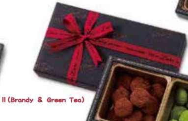
II (Brandy & Green Tea)